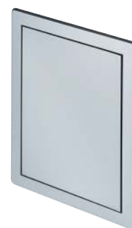
SATYNA SREBRNA SATIN SILVER